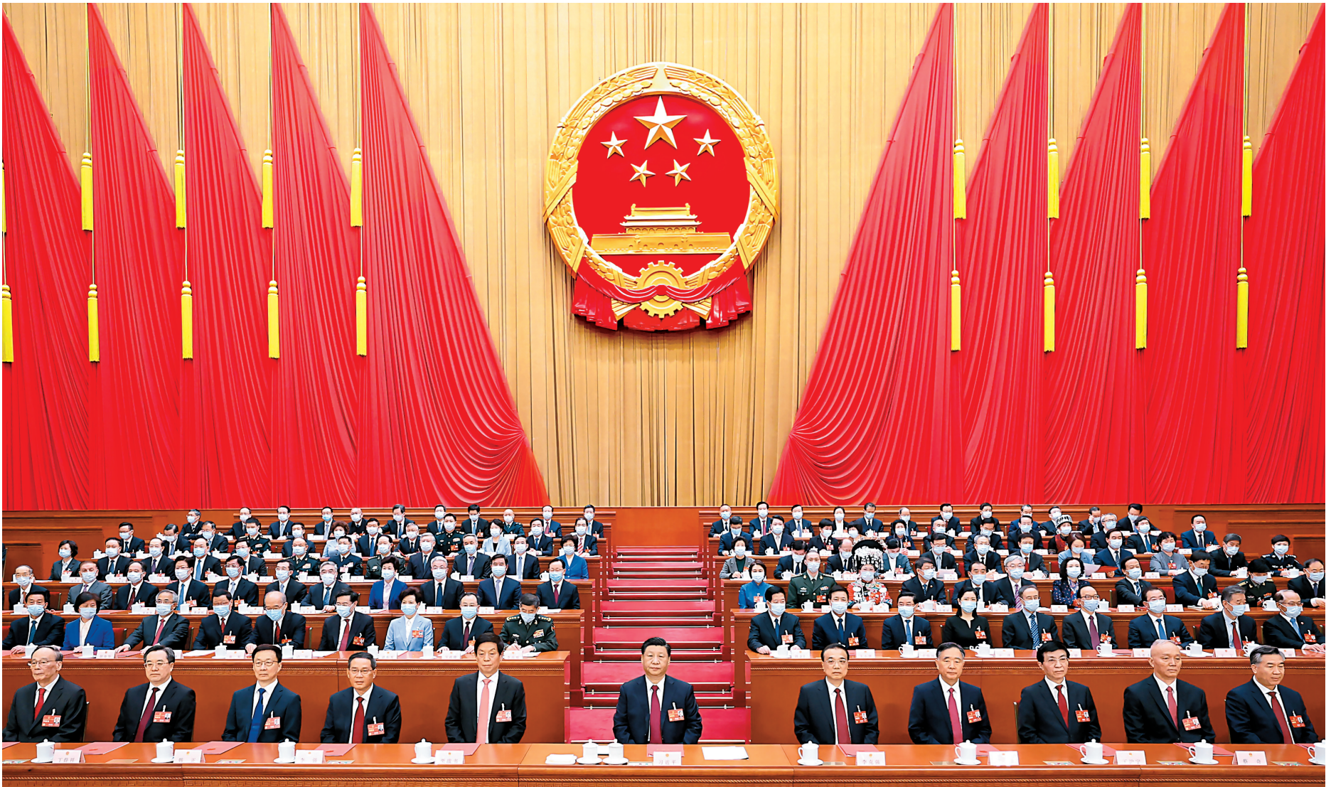
习近平等党和国家领导人在主席台就座

习近平指出，安全是发展的基础，稳定是强盛的前提。要贯彻总体国家安全观，健全国家安全体系，增强维护国家安全能力，提高公共安全治理水平，完善社会治理体系，以新安全格局保障新发展格局。要全面推进国防和军队现代化建设，把人民军队建设成为有效维护国家主权、安全、发展利益的钢铁长城。