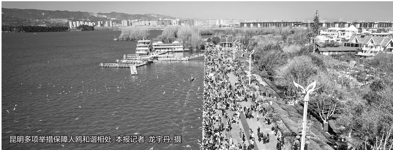
昆明多项举措保障人鸥和谐相处

禁止非法抓捕、猎捕、伤害、人工繁育红嘴鸥；禁止非法出售、购买、利用、运输、携带、寄递、食用红嘴鸥及其制品；禁止随意抛撒食物到湖泊水面投喂红嘴鸥；鸥粮售卖点禁止出售面包、饼干、狗粮、猫粮等其他食物……3月21日，《昆明市文明观赏红嘴鸥的规定》立法调研座谈会在昆明市林草局召开，以上是林草局草拟文本中的相关规定。