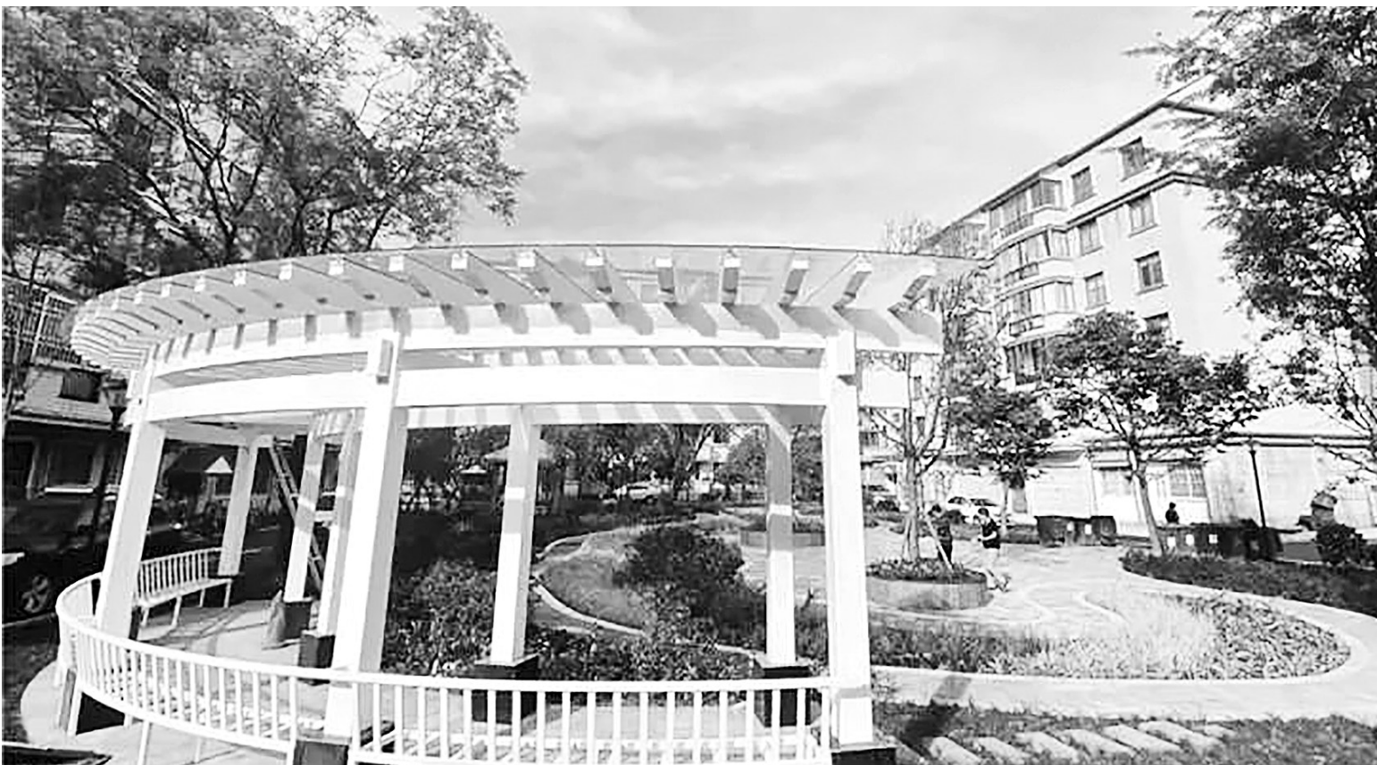
改造后的西山区隆居花园小区

“每天都在小区里‘抢车位’，要是回家晚一会儿就只能干瞪眼，要是能有个停车场就好了。”“小区里根本没有绿化可言，什么时候我们的小区也能变美？”“经常停水停电，小区环境卫生也不好，要是能有所改善就好了。”近日，记者对昆明多个老旧小区进行了走访，不少居民表达了自己的居住感受以及对小区改造的期待。