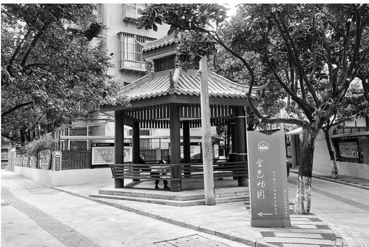
永昌社区面貌一新