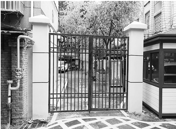
吴井街道东郊路社区干净整洁