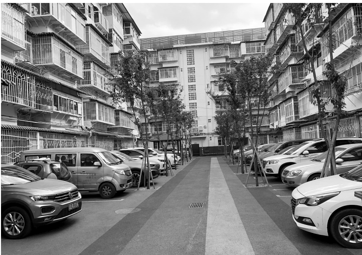
永昌社区车辆停放有序