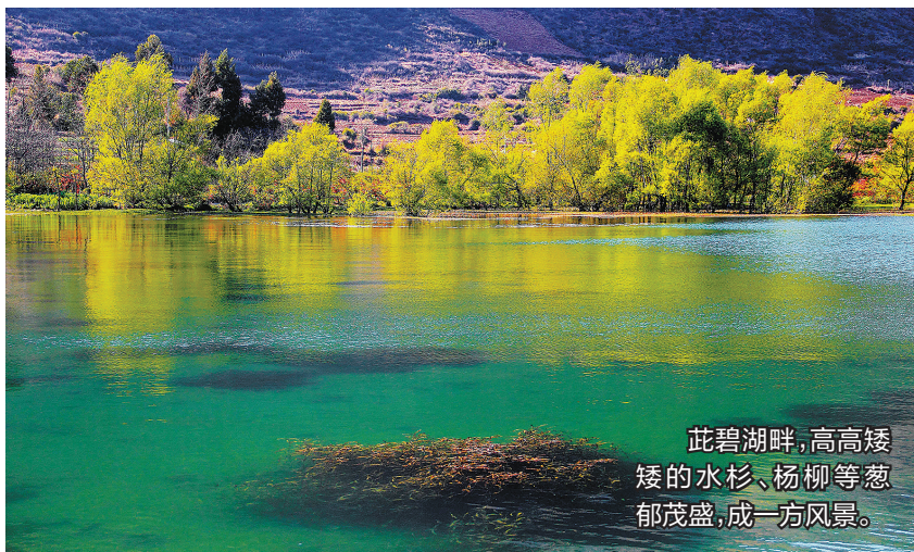
茈碧湖畔,高高矮矮的水杉、杨柳等葱郁茂盛,成一方风景。

人间最美四月天,正是踏青赏花时。大理洱源县城北端的茈碧湖高原水乡阳光明媚,清澈的湖水荡起阵阵涟漪。湖岸绿树成荫,草木葱茏,百花盛开,好似一幅生机盎然的秀美画卷,让这个青