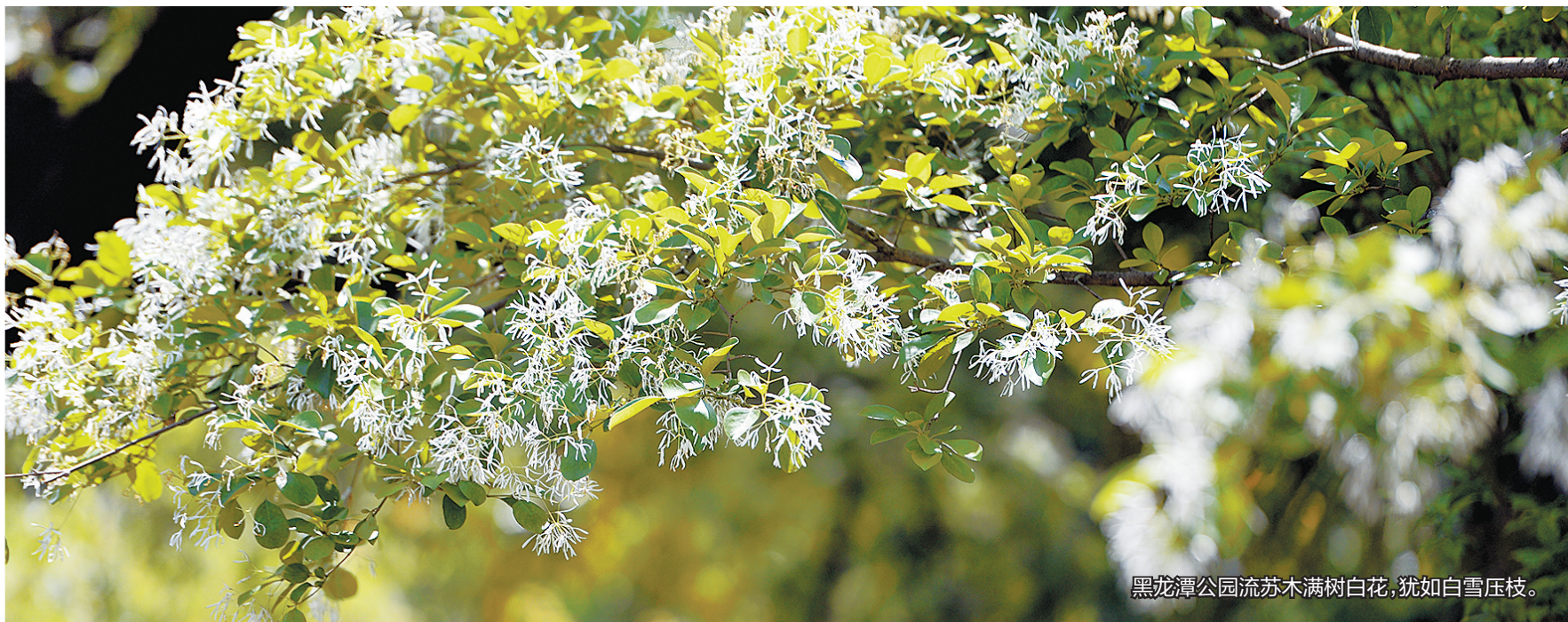
黑龙潭公园流苏木满树白花,犹如白雪压枝。