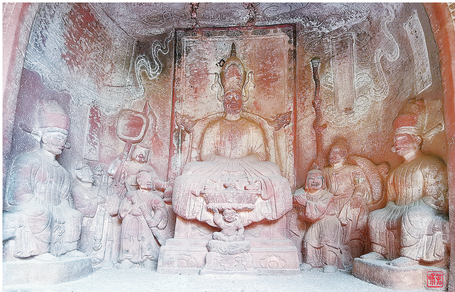
剑川石宝山石窟南诏王异牟寻坐朝造像,左边持杖披笠者即为清平官郑回。