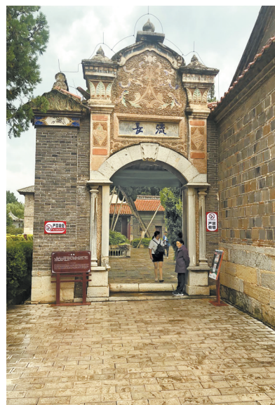
古色古香的龙氏家祠

沿着G56杭瑞高速行驶，在G85银昆高速昭通南收费站出站，导航至龙氏家祠。龙氏家祠位于昭通城南郊10公里处，是民国时期云南省主席龙云祭祖修建的祠堂。整个祠堂由一进三院构成四合九天井，由照壁、券门、过厅、两厢、正殿组成。宅院四合五天井，由正堂、两厢、倒座、碉楼组成宏大的建筑群。