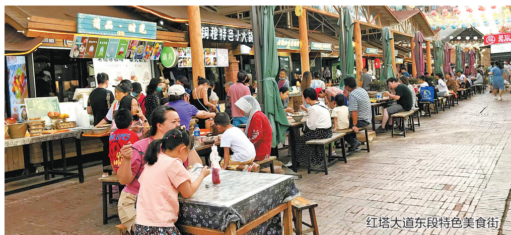
红塔大道东段特色美食街

红塔区黄官村肖家边，种植了大片的食用玫瑰。眼下，玫瑰花开了。游完老街，可搭乘公交车或打车到肖家边，到玫瑰花田里，感受采摘玫瑰的乐趣。