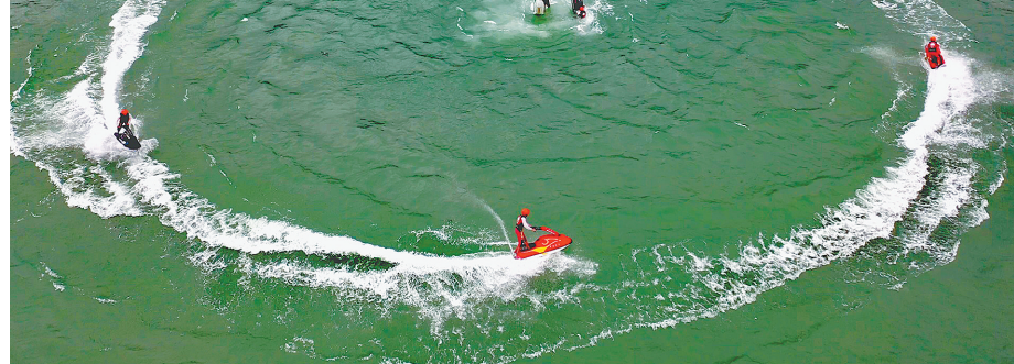
绥江金沙水上乐园特技表演

到绥江金沙水上乐园逛沙滩、吃美食、玩垂钓、坐游艇，观看国家水上特技表演队表演。队员们在宽阔的江面上进行各种超高难度的水上动作表演，定会让你直呼“刺激”。