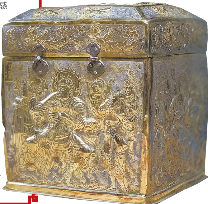
鎏金四天王 盃顶银宝函

罕见的玳瑁开元通宝惊艳亮相，工艺复杂的唐代大件香囊让人惊叹……“盛世风华——大唐地宫的惊世宝藏”特展的一件件精美藏品从6家博物馆运抵云南省博物馆。4月25日19时，本报记者现场直击“国宝”开箱过程。春晚传媒旗下的开屏新闻客户端，春城晚报官方微博、官方抖音、官方快手等多平台进行了近两个小时的独家直播，播放量达47.5万次。直播中，7件珍贵文物露出真容，众多网友跟随记者近距离感受到了唐代精美文物的细节之美。