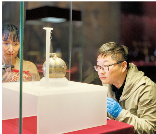
权飞将鎏金双蛾团花纹银香囊放入展柜