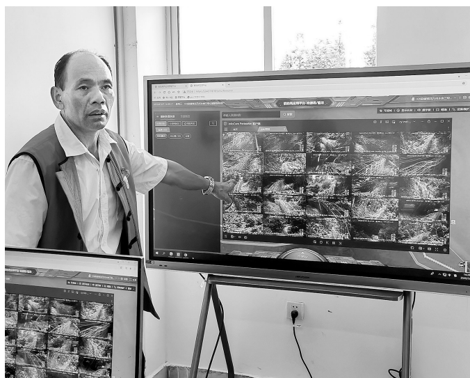
沧源县龙乃村联防所社会治理信息平台可监控到全村情况

近日,记者从云南省通信管理局获悉,迪庆州、西双版纳州、临沧市、普洱市作为2018年工业和信息化部确定的全国123个电信普遍服务试点州市,自实施边疆通信网络基站建设以来,共建设行政村4G基站5414个、5G基站27个,边疆地区4G基站2392个、5G基站3个,累计获得中央财政补贴约15.2亿元,带动基础电信企业在云南边疆地区投资超过35亿元,有力促进了我省偏远农村地区网络覆盖建设。如今,4个试点州市的偏远农村村民也能享受到高速移动网络带来的生活便捷服务。