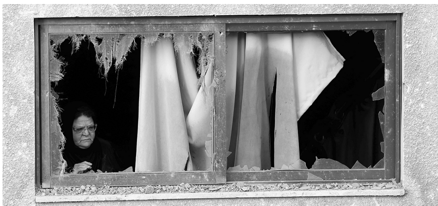
5月9日,在加沙城,一名女子从她在空袭中受损的居所内向外张望。

新华社加沙5月9日电(记者 柳伟建)巴勒斯坦加沙地带卫生部门9日说,以色列军队当天对加沙地带的空袭已造成15人死亡、22人受伤。