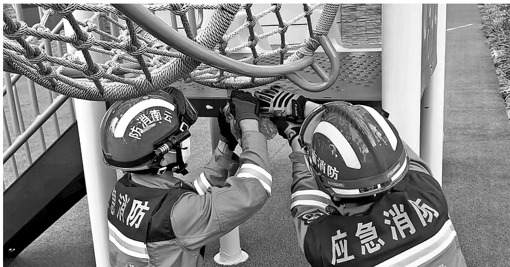
元谋县消防救援大队指挥中心出警处置置之蓝幼儿园的蜜蜂窝

摘马蜂窝、帮开门、救宠物……这些社会救助中常见的小事，却成了119热线整日面对的难事。一边是难以推辞的群众求助，一边是“非紧急占大警力”问题日益凸显。面对统筹群众利益无小事和消防救援忙主业之间的关系，改革破题之路如何走，半月谈记者在广西多地进行了走访调查。