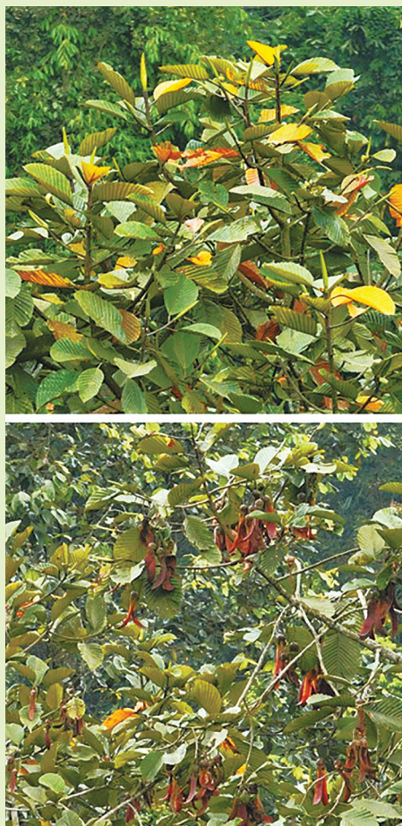
东京龙脑香是热带雨林中的古老树种

大果土楠为樟科土楠属的一个新成员,因其具有巨大的果实而被命名为大果土楠。与分布于我国南部、西南部和中南半岛邻近地区的其他土楠物种相比,大果土楠在形态学上具有巨大光滑的椭圆形果实、小枝光滑无毛以及花序被微柔毛等特征。该属植物在我国非常稀有,目前报道仅三种(其中两种为我国特有),分布于云南、广西、海南和台湾的热带地区。本报记者 杨质高 文