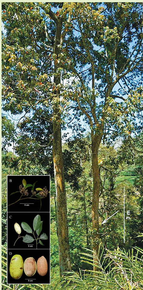
大果土楠具有巨大光滑的椭圆形果实