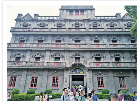
南昌八一起义纪念馆