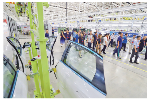
参观江铃集团新能源汽车有限公司