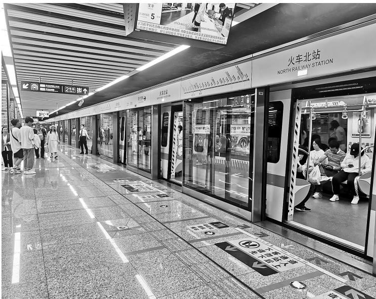
地铁5号线火车北站，车厢内外人不多。

昆明地铁5号线自2022年6月29日开通运营以来，客流量日益增长，成为市民日常出行的首选项。以“春城之旅”为主题的昆明地铁5号线加强了城市北片区与西南片区的交通联络，同时贯穿昆明大部分旅游景点，是昆明首条城市轨道交通旅游线路，因此它在开通前就备受关注。一年来，这条昆明地铁线路米字形骨架的重要支撑线路，如何改变着昆明市民的生活？连日来，记者对地铁5号线主要站点进行了走访。