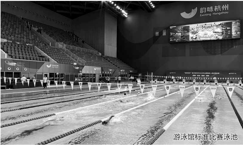
游泳馆标准比赛泳池

6月28日,杭州亚运会第二次世界媒体大会在杭州国际博览中心开幕,会期两天。本次大会旨在向参会媒体介绍杭州亚运会筹办工作的最新进展,帮助媒体及时了解杭州亚组委赛时提供的媒体服务。