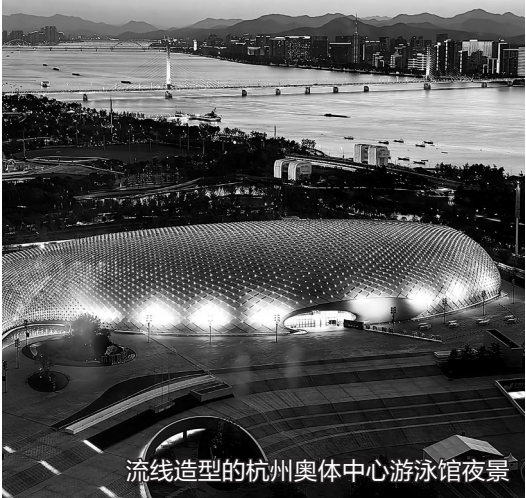
流线造型的杭州奥体中心游泳馆夜景

“每片‘大花瓣’重达160吨,8片‘花瓣’盛开只需要15至20分钟。”伴随着网球中心工作人员的讲解,媒体探秘亚运会场馆之旅开启,参观奥体中心体育馆、奥体中心游泳馆、奥体中心网球中心等场馆。