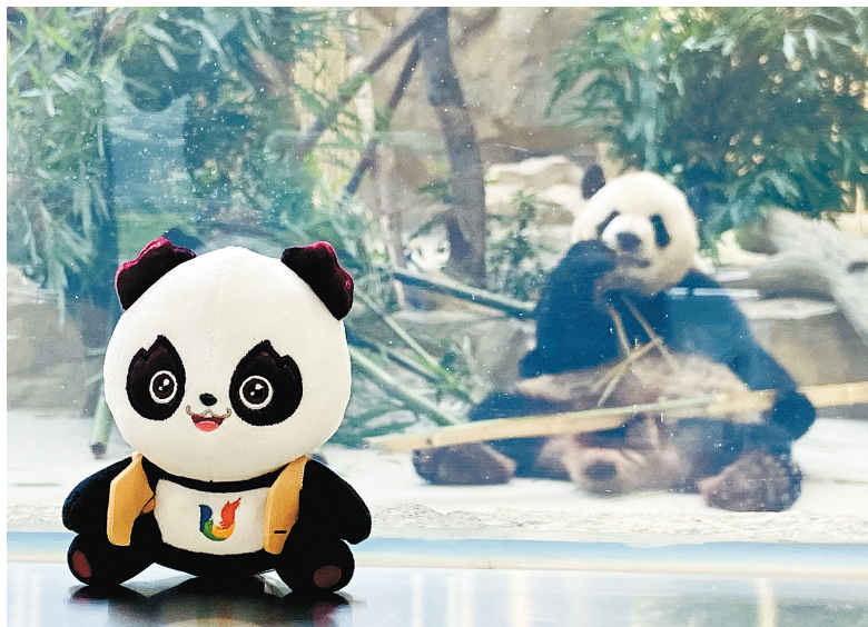
大熊猫“芝麻”，成都大运会吉祥物“蓉宝”的原型。

走出成都大运会的赛场，来自世界各地的运动员和游客在干什么呢？由于大运会和暑期叠加，最近成都大熊猫繁育研究基地的人流量明显比往常大。