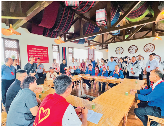
走进“托阿姆”调解室

3天时间里,代表、委员、特约监督员先后走进德宏州中级人民法院、芒市人民法院、瑞丽市人民法院及部分基层法庭、诉讼服务站,深入了解德宏州两级法院在司法助力“六稳”“六保”及推动矛盾纠纷源头治理等方面的工作情况,并积极为法院工作“把脉”、建言献策。