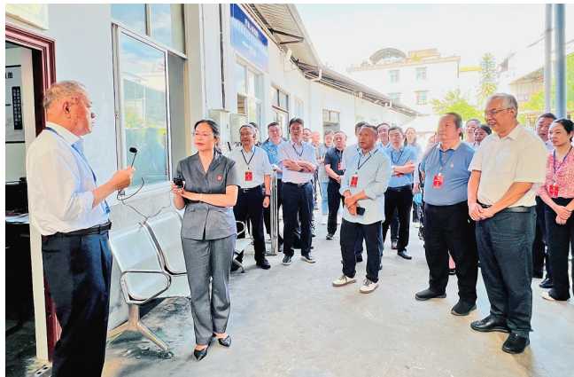
在芒市人民法院驻交通警察大队道路交通事故矛盾纠纷诉调对接便民点视察