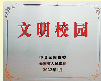
获得云南省“文明校园”荣誉