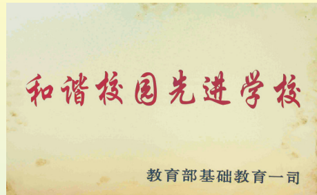
被教育部基础教育司评为“和谐校园先进学校”