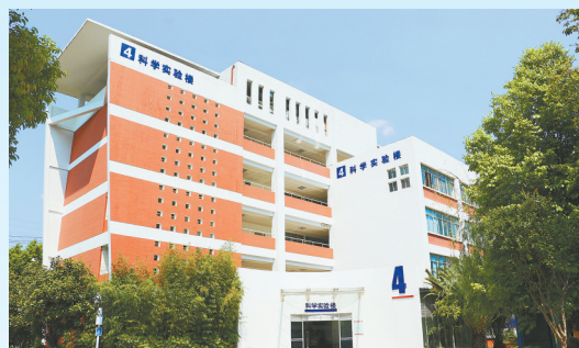
实验设备一应俱全