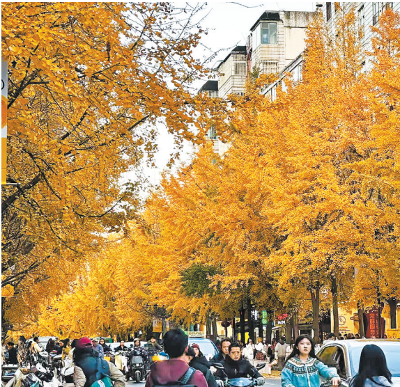
12月5日的文林街一片金黄