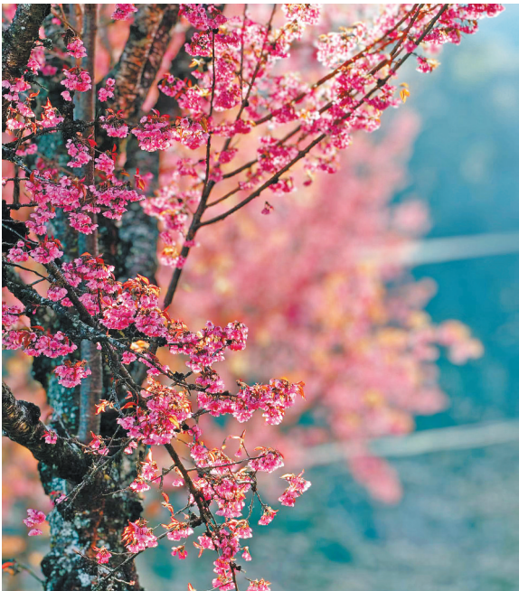
当前正值盛花期