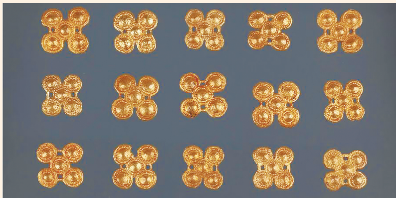
晋宁石寨山出土的西汉梅花形金片饰，蕴含北方草原文化元素。