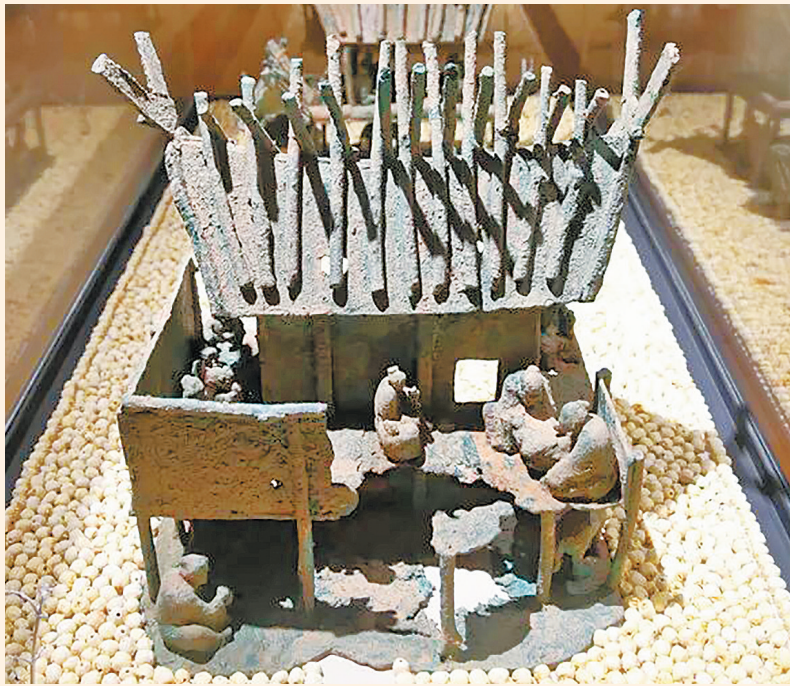
2018年6月拍摄的“滇国青铜房子模型”，展现了当时滇国人生活起居细节。

抱鸡，一人捧一酒器。其中，鸡的体形颇大，尾羽很长，也为鸡作为庆祝猎虎的美食提供重要人类学依据。近年来的基因研究证实，中国西南地区极可能是世界家鸡的驯化中心之一。青铜头盔上的鸡形象，正好与现代科研成果形成呼应。这一图案，不仅是古滇人的生活写照，也成为古代云南与世界家禽驯化史的关联之一。