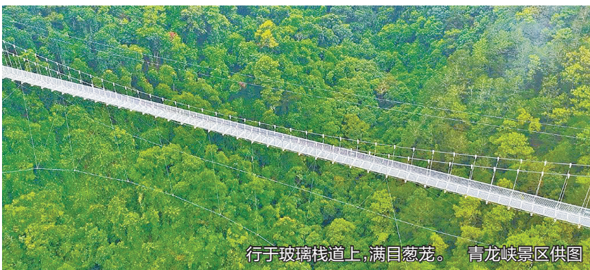
行于玻璃栈道上，满目葱茏。

青龙峡“杀猪宴”是一席由时间慢煮的盛宴。柴火灶上久炖的土猪肉酥软入味，轻抿脱骨；炊烟与肉香交织，直抵心间。而那锅慢熬数小时、仅以盐调味的清汤，清澈鲜美，让人连喝数碗也回味无穷。要注意的是，428元一桌，一桌