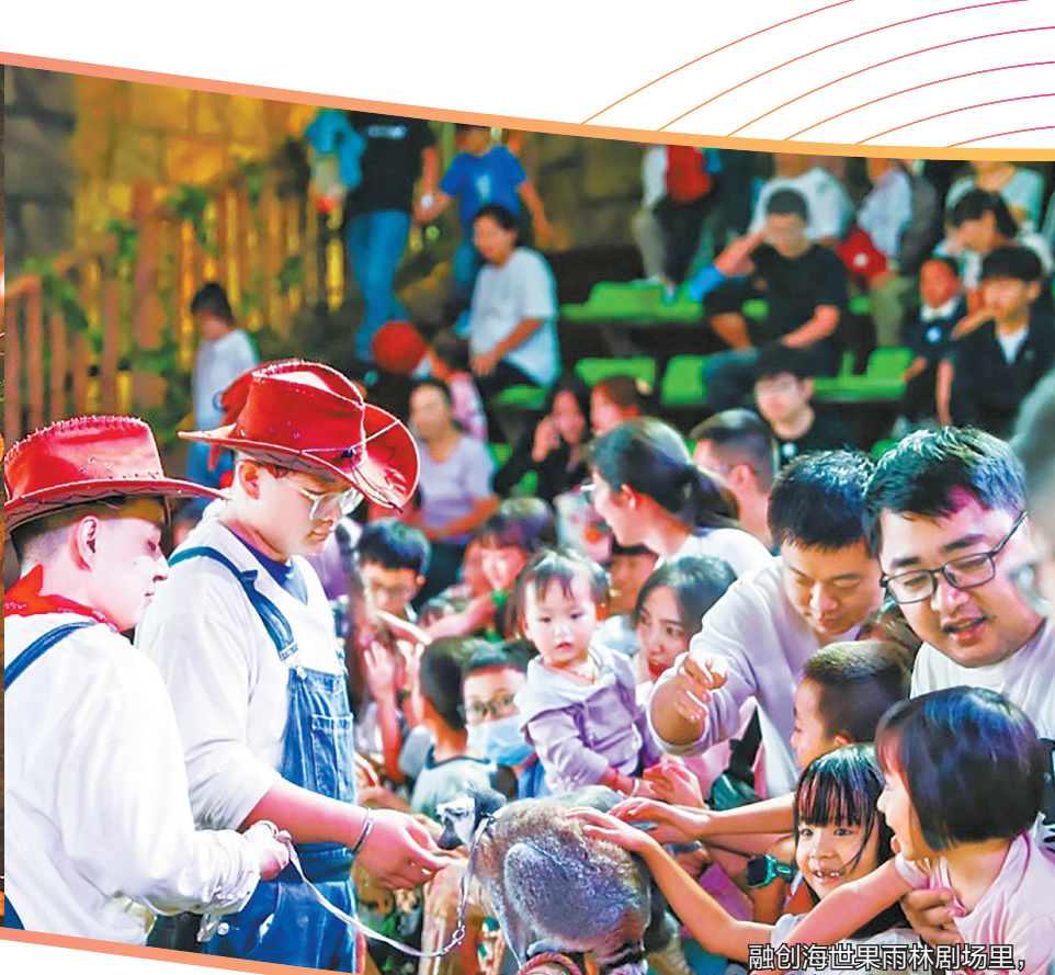
融创海世界雨林剧场里，游客与萌宠互动。