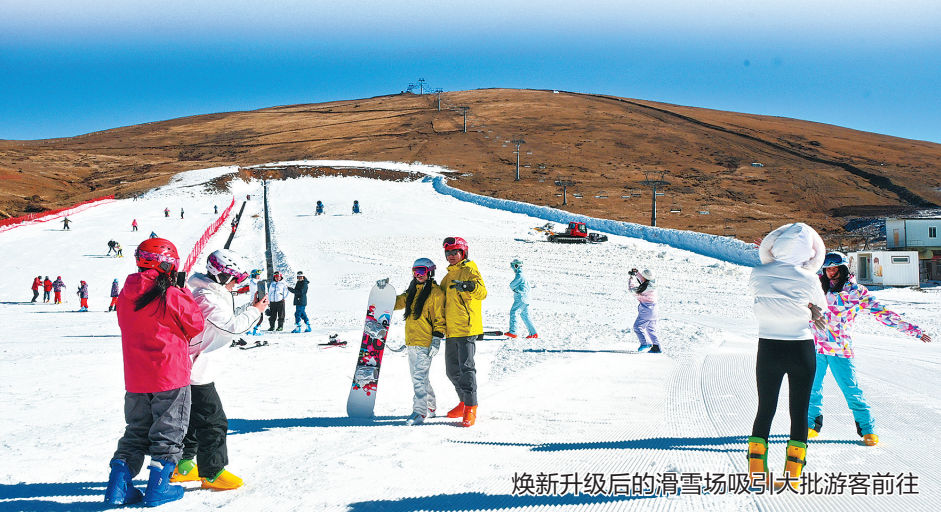
焕新升级后的滑雪场吸引大批游客前往