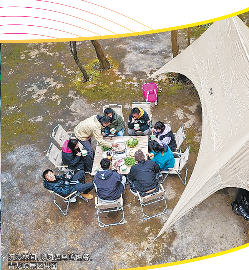
沉浸林间，以风语鸟鸣佐餐。