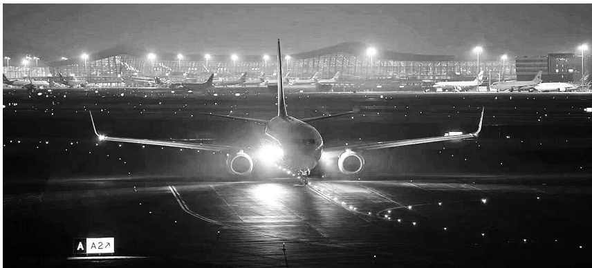
客机平稳降落在崭新的东二跑道上

试飞工作由民航云南安全监督管理局组织开展,昆明航空负责试飞任务的具体执行,云南空管分局、云南机场集团配合做好管制指挥与机场地面保障