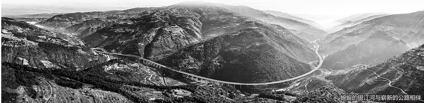
蜿蜒的银江河与崭新的公路相伴