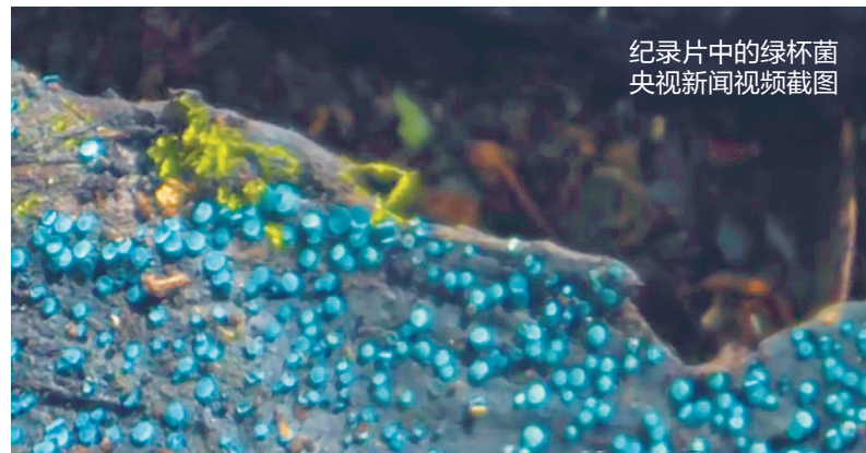
纪录片中的绿杯菌

能孕育出绿杯菌这样的独特物种,离不开哀牢山新平片区得天独厚的生物多样性基础。12日,记者从云南哀牢山国家级自然保护区新