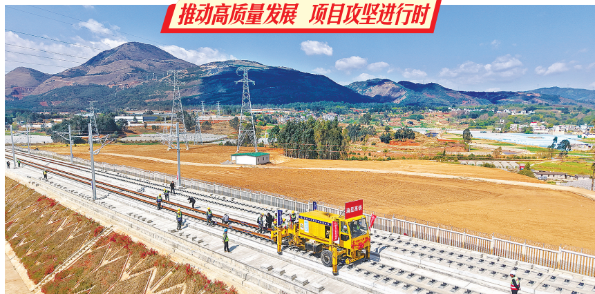
铺轨施工现场

质地貌错综复杂,桥隧比高达87.4%,超10公里的长大隧道多达10座。“针对渝昆高铁集复杂地质、长大隧道群、30%连续长大坡道于一体的特点,我们