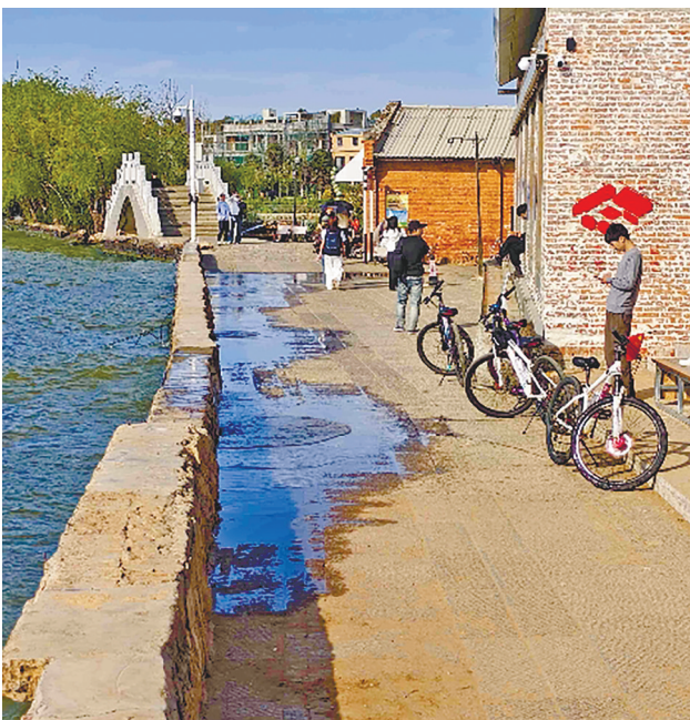
20日下午,天气晴朗,游人在海晏村堤坝漫步、休息。

3月17日下午,昆明市呈贡区海晏村滇池沿岸突遭狂风大浪袭击。8级以上大风引起的大浪让湖水越过岸堤,倒灌进岸边区域,造成多家商铺、旅游设施受损,所幸未造成人员伤亡。