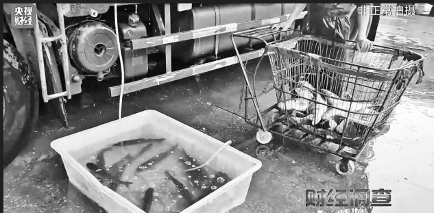
商贩换水、打氧后，“沉睡”的鱼很快就重新游动。

工人往桶里加一瓶盖液体搅拌后，活蹦乱跳的鱼瞬间安静瘫软……商贩称运输活鱼时加麻药，是为方便装卸、防止在运输过程中掉鱼鳞。而这些麻药是丁香酚、工业酒精等“三无”产品。央视《财经调查》记者历时2个多月，跨越重庆、山东临沂、安徽宿州等地，深入水产市场、生产企业和餐饮门店，在活鱼流通的每一个环节暗访调查，一个让活鱼“休眠”的秘密，逐渐浮出了水面。