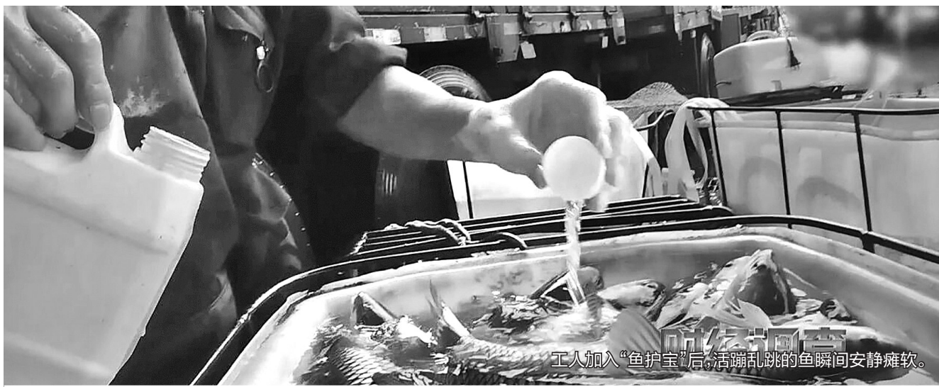
工人加入“鱼护宝”后，活蹦乱跳的鱼瞬间安静瘫软。