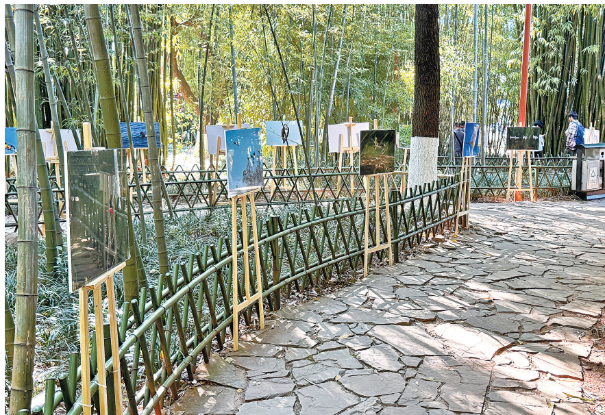
通过展览向公众普及鸟类知识