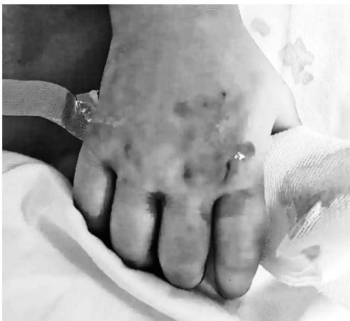
女童手部淤青并留有毒蛇牙印