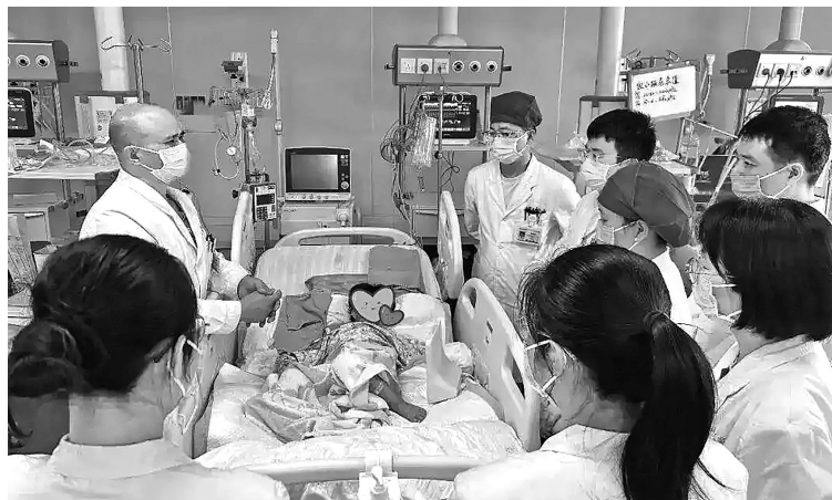
女童在重症监护病房接受治疗