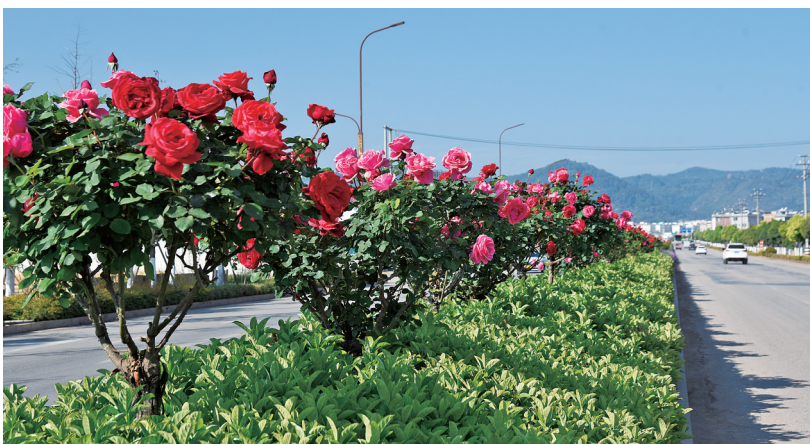
秀山东路一路繁花