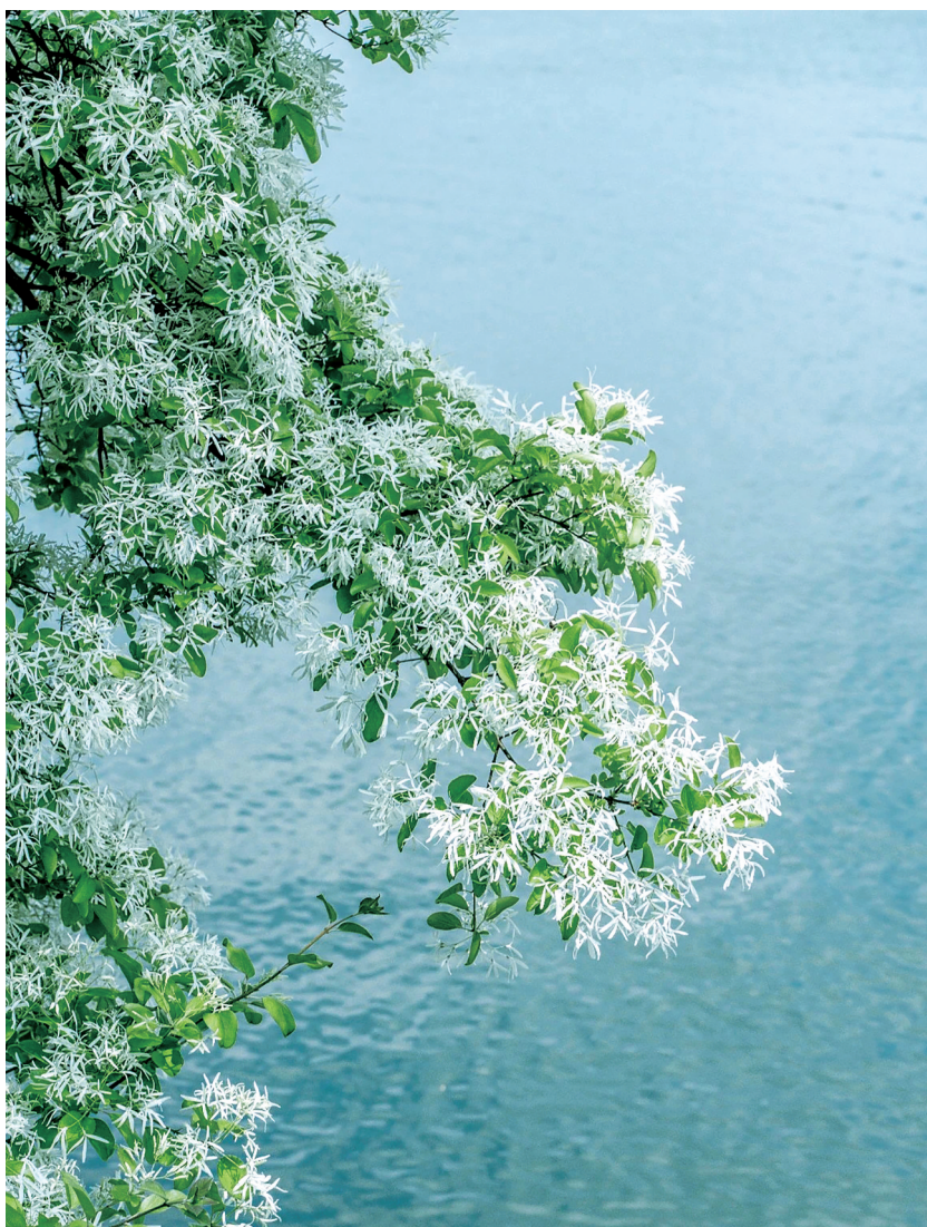
一树流苏白,满池清波绿。