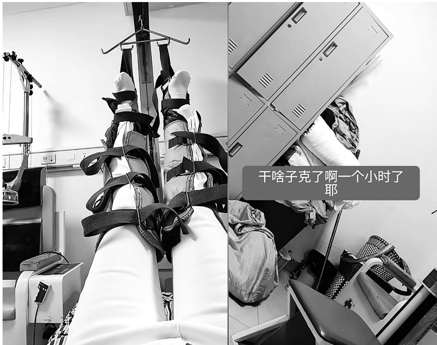
由于被吊了一个多小时,她当时出现了腿麻的症状。 视频截图

近日,贵州仁怀一名女子称,自己在医院接受牵引治疗时,因医生未及时解除设备,自己双腿被悬吊一个多小时,其间多次呼喊无人应答,最终只能请朋友赶来叫医护人员方才得以解困。