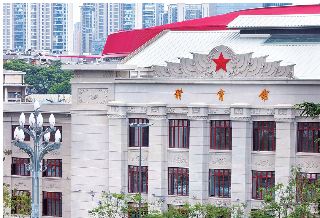
拓东体育馆修旧如旧，保持原有风格