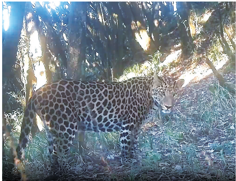
红外相机捕捉到金钱豹影像

近日,云南南滚河国家级自然保护区管护局开展大型猫科动物监测时,红外相机拍摄到国家一级重点保护野生动物金钱豹清晰的活动影像,这是金钱豹在南滚河保护区耿马片区活动的首次影像记录,标志着该物种在云南南滚河国家级自然保护区的分布点位进一步扩展。