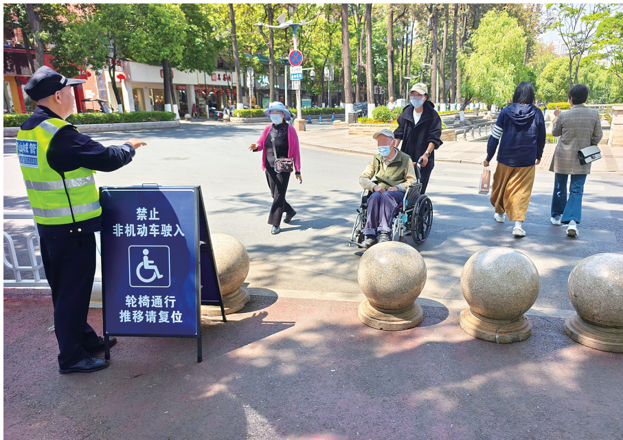
14日下午,翠湖边增设了“轮椅专用出口”并有专人值守。

近日,有市民通过春城晚报一开屏新闻热线6410000反映,翠湖环湖步道,尤其是翠湖东路段数百米范围被石墩封堵,轮椅难以进出,给残障人士出行带来不便。华山街道办事处在了解到群众诉求后,在各关键路口分别将石墩组移除了一个,留出约一米宽的空间满足轮椅及婴儿车通行。