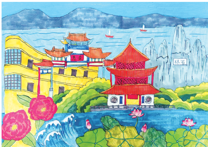
《昆明三景记》常如意