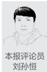
本报评论员 刘孙恒

台风天强制配送,无异于是拿外卖小哥的生命当儿戏,是侵犯员工职业安全、不尊重员工权益的一种体现。