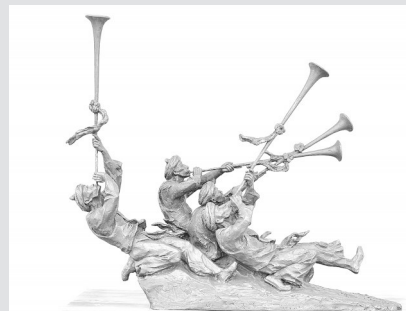
雕塑 杨白春《好日子》