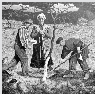
油画 周章科《奠基树》