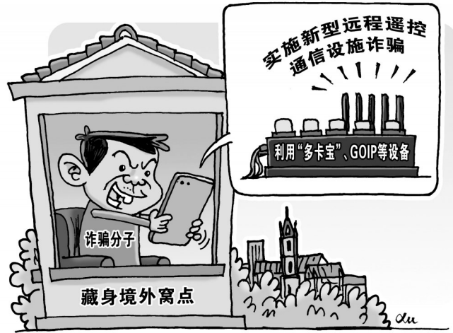
徐骏 作