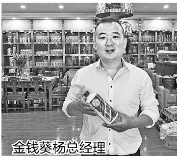
茅台酒回收价格表